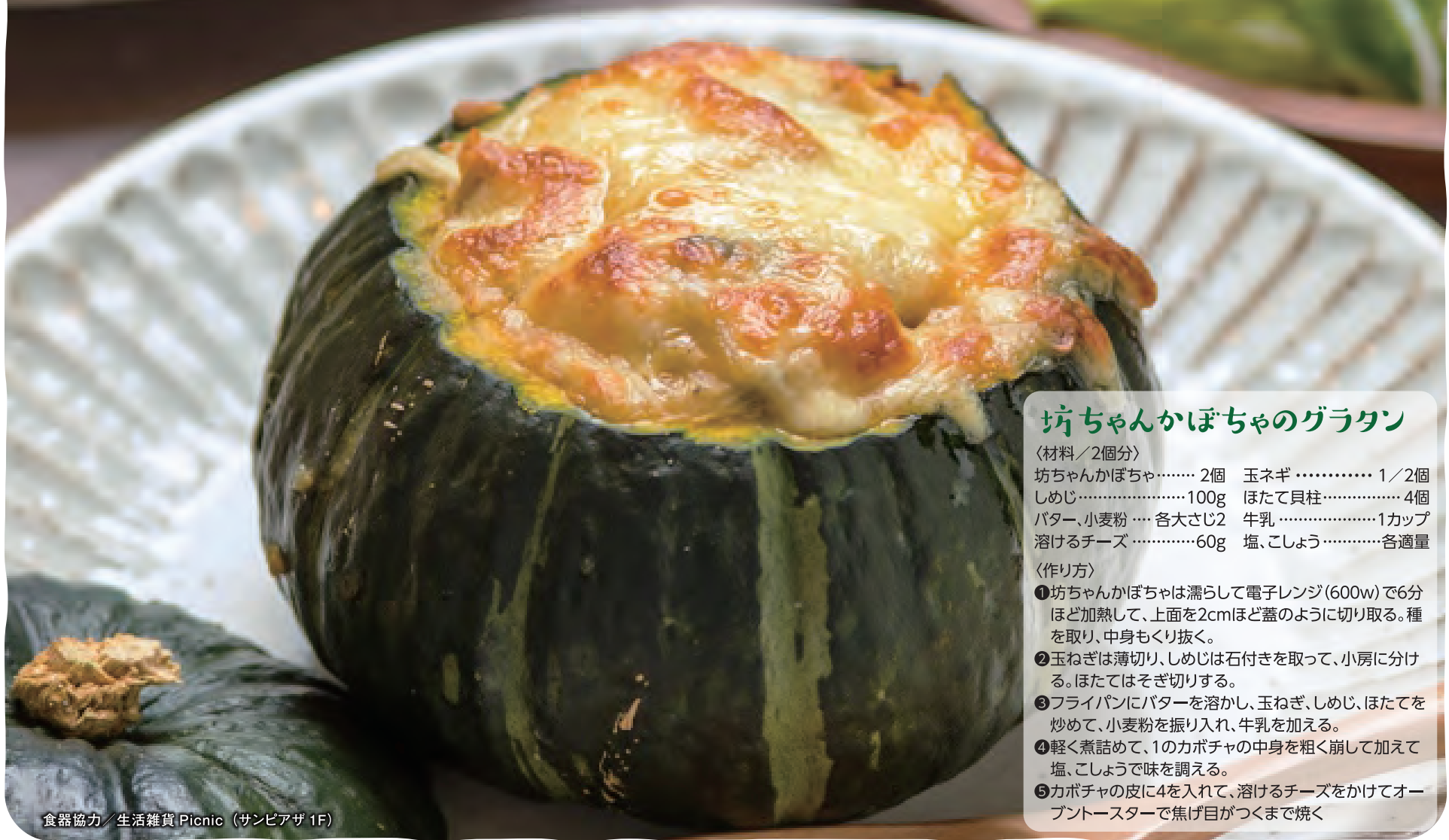
食器協力/生活雑貨Picnic (サンビアザ 1F)